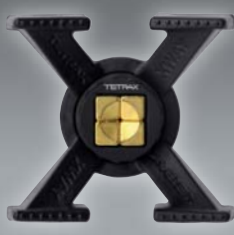
Ref. 72016 XWAY