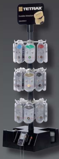
Ref. 72117 Mini display na ladę Ref. 72121 Mini display stojący

MINI display na ladę lub stojący zawierają po 36 szt. następujących produktów Tetrax®: