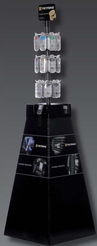
Ref. 72116 Maxi display na ladę Ref. 72120 Maxi display stojący

MAXI display posiada takie samo wyposażenie jak MINI display.