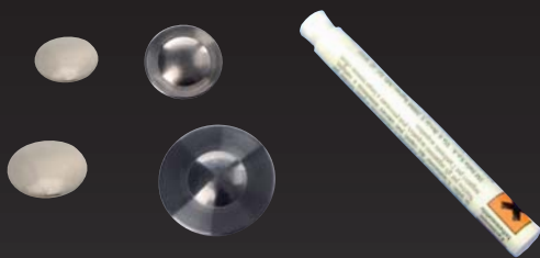
Ref. Z075041 Akcesoria

W zestawie znajdziesz 7 klipów wykonanych z metalu i taśmy konstrukcyjnej 3M® o dużej wytrzymałości. Klipy charakteryzują się różnymi rozmiarami (średnica 8,5-10-14 lub 20 mm) i kolorami (jasno i ciemnoszary). Klipy służą do mocowania na powierzchni wszelkich urządzeń elektronicznych. W zestawie znajdziesz także aktywator ułatwiający przyleganie klipów i/lub modelu FIX do szczególnie trudnych powierzchni.